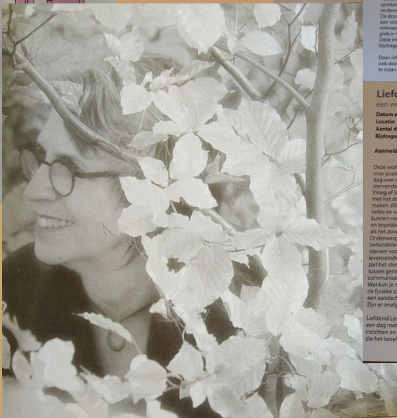
'Er is ruimte en aandacht voor de mystieke kant van sterven en om de wonderen van liefde en verbinding in alle volheid te ervaren.'